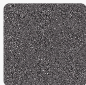
Antracit Gránit K203 PE Felületi struktúra: Gyöngyház